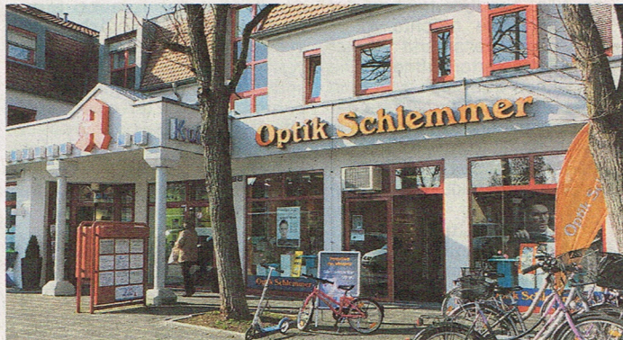
Ein echtes Gesundheitszentrum an der Eibacher Hauptstraße mit dem traditionsreichen Optikerfachgeschäft Schlemmer.

Das „Gesundheitshaus“ mitten in der Eibacher Hauptstraße beherbergt neben einer Apotheke, einem Kurbad und dem renommierten Augenarzt Voigt idealerweise auch gleich Optik Schlemmer. Da kann man den Augenarztbesuch gleich mit dem Brillenkauf verbinden und dadurch Zeit sparen. Die Geschäftsräume des Eibacher Optikers, präsentieren sich freundlich-modern, hell und einladend. Ein anderer Grund das Geschäft zu besuchen sind die attraktiven Sonderangebote. „Wir haben