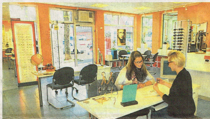
Viel Platz für intensive Kundenberatung bieten die freundlich hellen Räume der neun Schlemmer-Filialen.

Kunden-Porträt eine Brille virtuell projiziert, bei der Form, Größe und Farbe der Brillenfassung solange angepasst werden, bis alles perfekt passt.